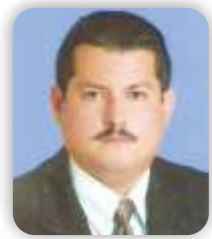
Elaborado por: Oscar Gerardo Meneses Rubio Catedrático UFPS Licenciado en Comercio – Contador Público Especialista en Revisoría y Auditoría Magíster en Calidad y Gestión Integral

En un nuestro entorno cotidiano hablar de crecimiento verde podría sintetizarse como sembrar más árboles, más pasto verde, más del campo a la ciudad, etc... Para nuestro gobierno de turno consiste en que el desarrollo del país no cambie su trayectoria por cuenta del ambiente, o sea, esto no es decirle a la gente que vamos a crecer tanto por ciento menos, sino que podemos crecer a la misma velocidad que se necesita para desarrollarse y cumplir con sus expectativas, pero de manera compatible con el clima y con el ambiente.