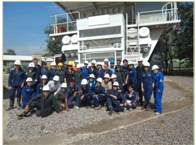
Práctica de campo de estudiantes del PIMI en el Cerrejón.

Estos convenios consagran el compromiso de las partes de apoyarse mutuamente en lo tecnológico, lo empresarial y lo académico y, en especial destacan la voluntad manifiesta de las Empresas de ofrecer y permitir sus espacios laborales para la realización, por parte de los estudiantes del PIMI, de la práctica profesional, de prácticas normales de asignaturas y de realización de trabajos de grado.