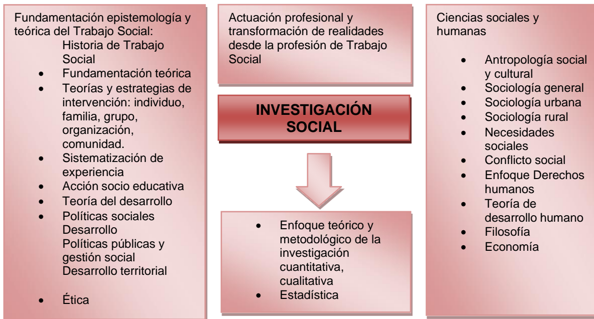
Figura No 1. Diagrama de la Estructura conceptual del saber del PEP de Trabajo Social