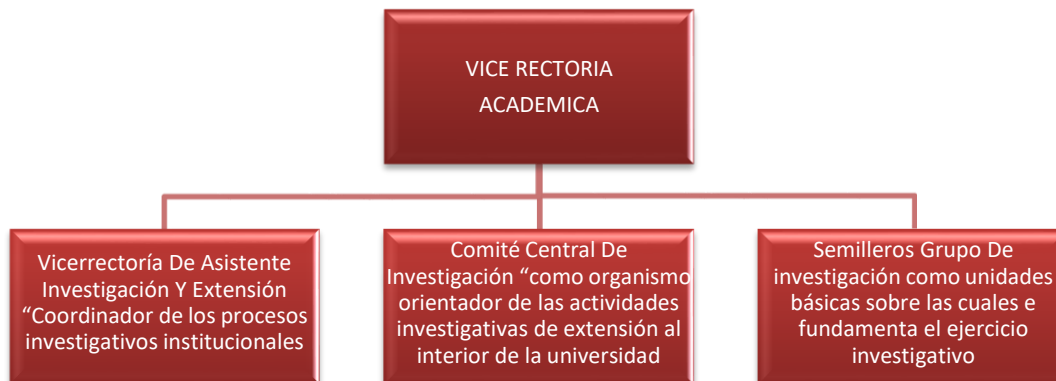
Figura 2. Componentes del sistema de investigaciones

En este marco general, la Universidad Francisco de Paula Santander reafirma su vocación investigativa y plantea las políticas, que orientan esta actividad como marco guía para las unidades académicas y los investigadores, enmarcados dentro del Acuerdo No 056 de 12 de septiembre de 2012, del Consejo Superior Universitario.